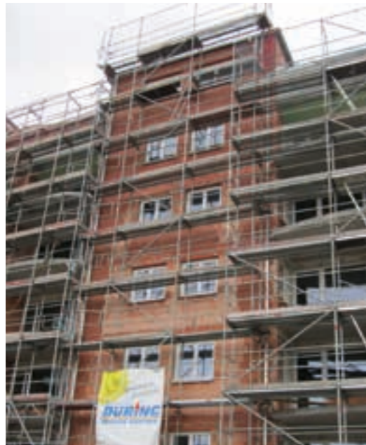
Im Eingangsbereich wurde zusätzlich gedämmt. Mit der massiven Wärmedämmfassade Poroton-WDF ist die Oberfläche dabei besonders robust.

Weil das 60 Meter lange Grundstück gen Süden um etwa 1,5 Meter abfällt, wurde ein Sockelgeschoss geschaffen, wodurch die Wohn-Ebenen dennoch über den gesamten Bau auf demselben Niveau liegen, beginnend beim Hochparterre. Darunter befindet sich eine Tiefgarage mit 51 Stellplätzen, außerdem vereint das Sockelgeschoss die Funktionsräume: Abstellräume, Fahrradraum, Müllraum und den Pelletspeicher für die mit einer Gastherme kombinierte Pelletheizung. Energetisch hat das Gebäude den Standard eines KfW-70-Hauses nach EnEV 2009. Erschlossen wird die gesamte Anlage über zwei Treppenhäuser (jeweils mit Aufzug) und eine zentrale Hofeinfahrt. Das Sockelgeschoss hielt der Architekt in Sichtbeton, für die Hofeinfahrt wählte er eine Sonderlösung: Dort sorgt die Wärmedämmfassade mit massiven Ziegelqualitäten für eine ebenso optimal isolierte wie mechanisch strapazierfähige äußere Haut.