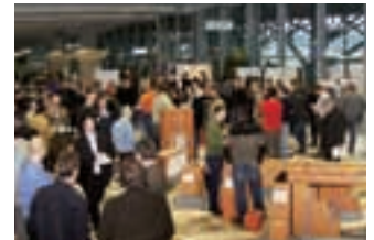
Auch 2007 wird es wieder eine umfangreiche Rahmenausstellung während der Wienerberger Mauerwerkstage geben. Planer und Bauausführende können sich hier aus erster Hand über neueste Technologien im Mauerwerksbau informieren.