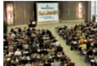
Praxisorientierte Themen und namhafte Referenten machen die Wienerberger Mauerwerkstage zu einem gefragten Weiterbildungsforum, das allein in 2006 bundesweit rund 3.000 Teilnehmer anzog.

Den nachstehenden Tabellen entnehmen Sie bitte die Termine und Orte für diese Veranstaltungsreihe. Wir freuen uns, Sie und Ihre Mitarbeiter auf einer unserer Veranstaltungen zu begrüßen.